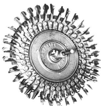
Plantehjul med fjederpåkirkede gribere for plantning af barrodsplanter

Reihenanzahl: 3-5 Breite: 1700 mm Länge: 2800 mm Gewicht: 3 Reihen: 420 kg, 4 Reihen: 555 kg, 6 Reihen: 630 kg