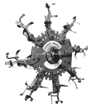
Plantehjul med fjederbelastede gribere Planting wheel with spring-loaded grippers Pflanzrad mit federbelasteten Greifern

Gummischeibenpflanzrad für Pflanzung von sowohl Barwurzel-Pflanzen als auf Topfballen