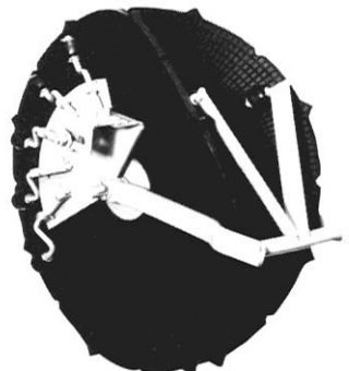
Gummiskiveplantejul for planting af såvel barrodsplanter som pottede planter

Pflanzrad mit federbelasteten Greifern für Pflanzung von Barwurzel-Pflanzen