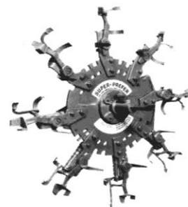
Plantehjul med fjederbelastede gribere Planting wheel with spring-loaded grippers Pflanzrad mit federbelasteten Greifern

Gummischeibenpflanzrad für Pflanzung von sowohl Barwurzel-Pflanzen als auf Topfballen